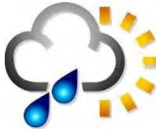
« Météo »