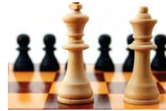
« Echecs »