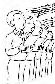
« Chorale »