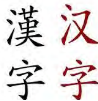
« Chinois »