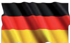
BILANGUE ANGLAIS - ALLEMAND